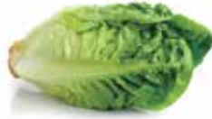
Little gem verde/ roja