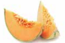
Melón Cantalup / Galia/ Amarillo